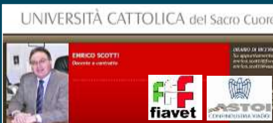
UNIVERSITÀ CATTOLICA del Sacro Cuore