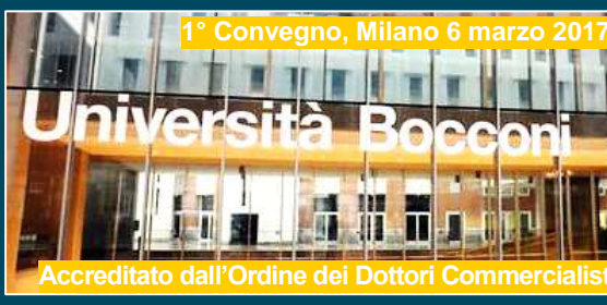
1° Convegno, Milano 6 marzo 2017